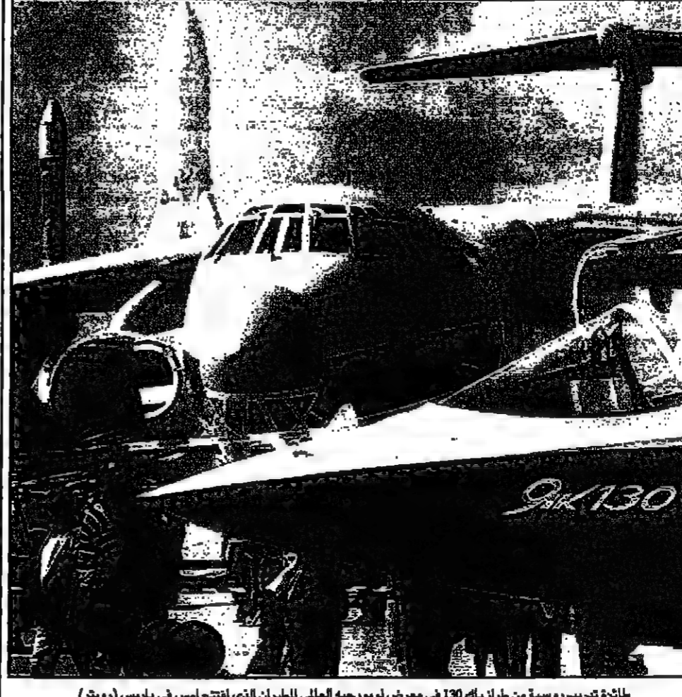
مطاركة كبريت روسية من طراز بيه 130 في معرض ليوبروجيه العالمي للطيران الذي افتتح امس في دبويش (دويتش)

دبي - رويترز - قال مركز بحثي للتداول للبيانات بالبرازيل ان حجم التداول بلغ بزيادة في سوق الأسهم السعودية الاسيوية للاسبوع الماضي كان الاكبر من المثلث من وقت التداول لثلاثي ايام متتالية. وقال مسؤولون في سوق الأسهم السعودية ان حجم التداول بلغ بزيادة في سوق الأسهم السعودية الاسيوية للاسبوع الماضي كان الاكبر من المثلث من وقت التداول لثلاثي ايام متتالية.